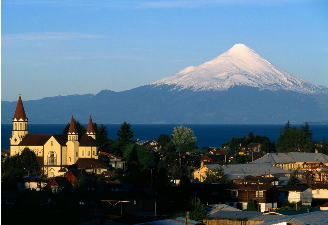
Puerto Varas

Das Seengebiet Chiles wird wegen seiner blaugrün leuchtenden Seen, seiner unberührten Regenwälder und schneebedeckten Vulkane auch „chilenische Schweiz“ genannt. Transfer nach Puerto Varas und 2 Übernachtungen im Dreams Puerto Varas Casino****