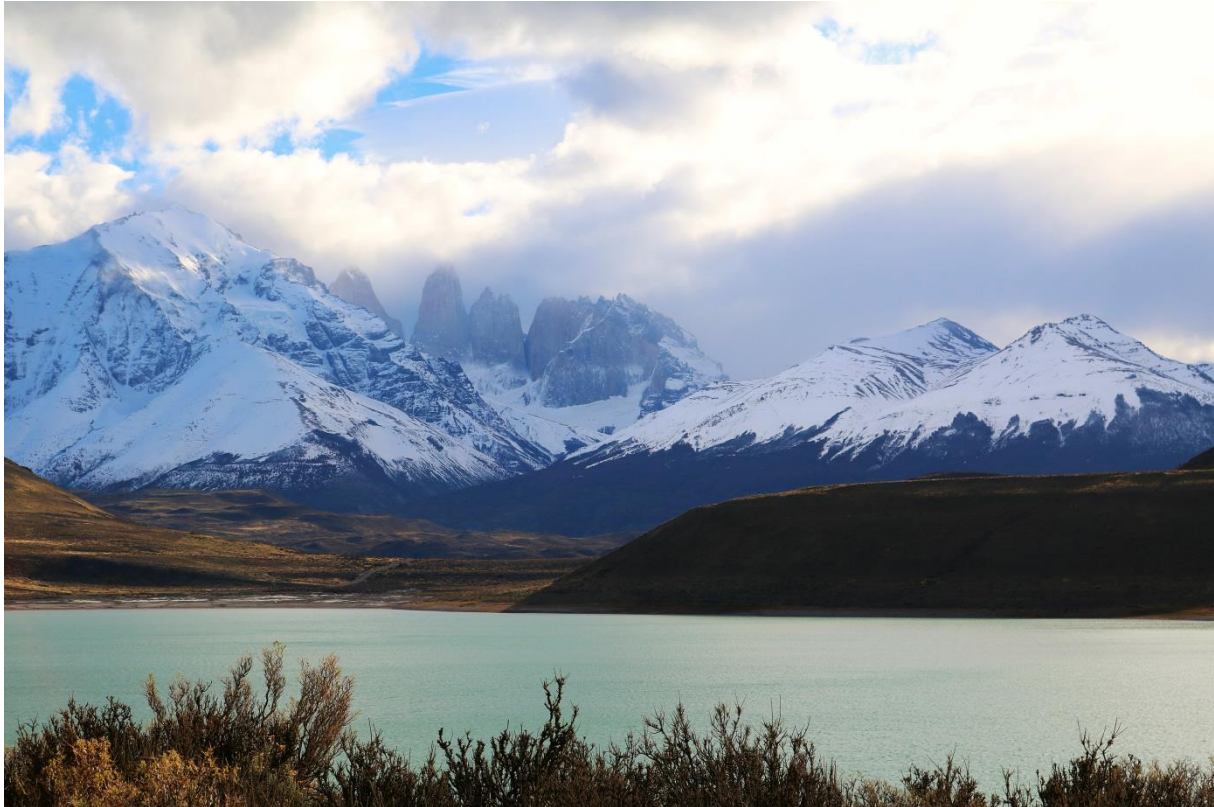
Laguna Amarga und Torres del Paine

Sie besuchen die wunderschönen Lagunen im Nationalpark: Zunächst geht es zur Laguna Amarga , die „bittere Lagune“, benannt nach ihrem bitter schmeckenden Wasser, welches einen hohen Salzgehalt hat. Mit ein bisschen Glück können Sie hier Flamingos beobachten. Die Laguna Azul wurde nach ihrer tiefblauen Farbe benannt. Bei einer Wanderung entlang der Lagunen können Sie die fantastische Naturkulisse auf sich wirken lassen.