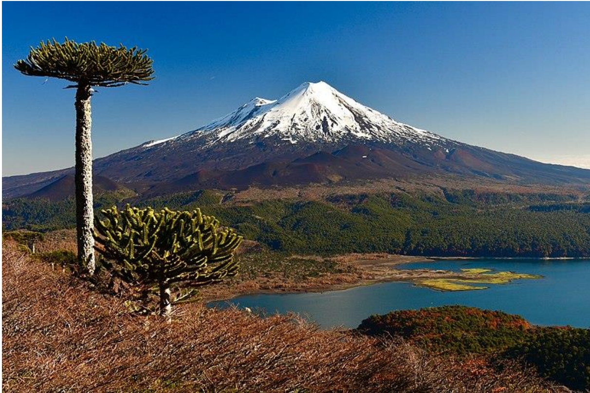
Volcán Llaima und Laguna Conguillío

Ziel ist die Laguna Conguillio , die in der Mitte des Nationalparks liegt und von tausendjährigem Araukanienwald umgeben ist. Sie unternehmen einen Spaziergang entlang des Ufers des kristallblauen Sees. Danach beginnt Ihre Wanderung durch den immergrünen, kalten Regenwald, welcher typisch für Südchile ist. Sie wandern durch dichten Wald immer weiter hinauf, bis Sie zu einem Aussichtspunkt mit Blick auf die Lagune und die beeindruckende Landschaft gelangen.