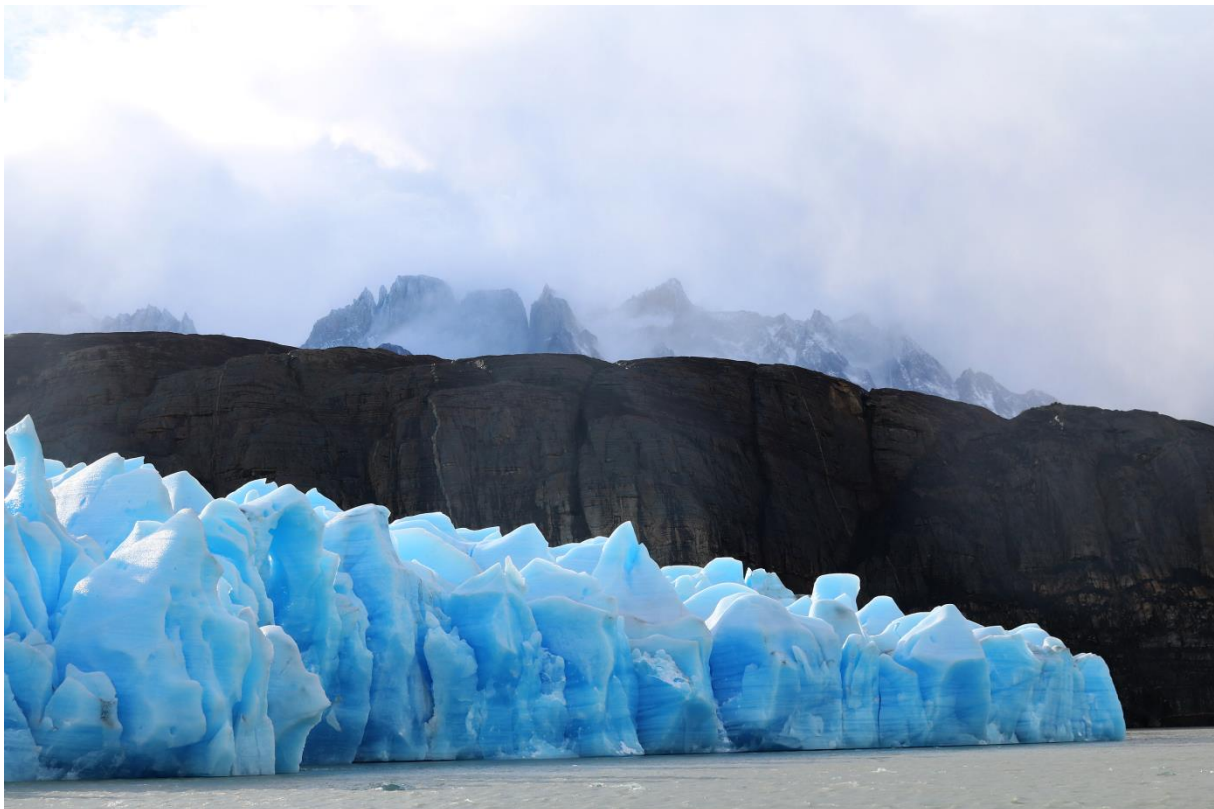
Grey Gletscher; © Karawane Reisen

Hinweis: Der Ausflug ist nicht exklusiv für die Gruppe. Leichter Weg zum Gletscher Serrano mit Auf- und Abstiegen auf einem steinig und sandigen Pfad, der an den See grenzt.