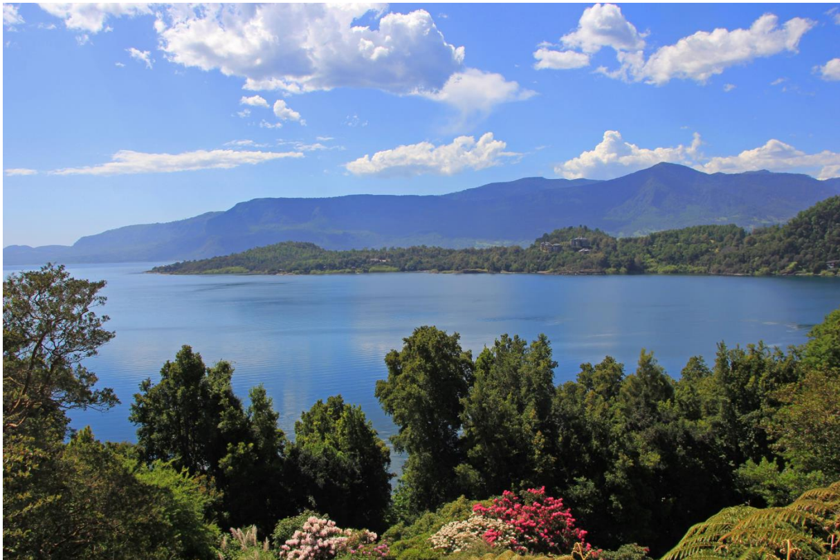
Bei Pucón