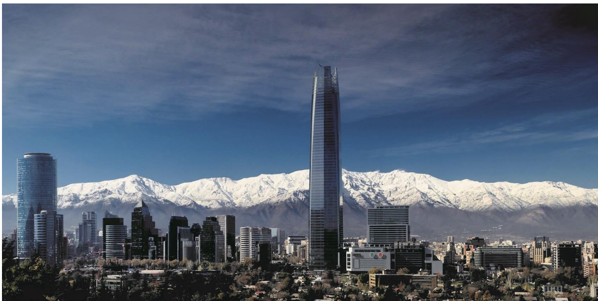
Santiago de Chile; © Karawane Reisen