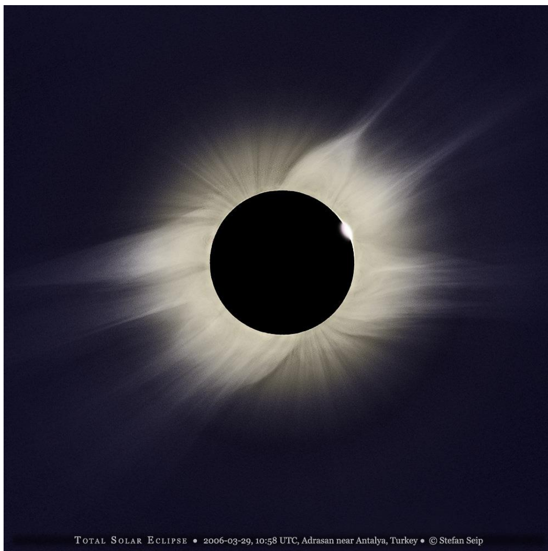
Totale Sonnenfinsternis am 29.03.2006 in der Türkei

In den vergangenen Jahren hat er mehrfach für uns Sonnenfinsternis-Reisen fotografisch und astronomisch betreut.